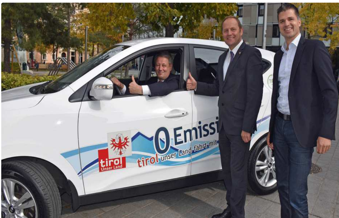
Die Zukunft der Mobilität ist lautlos und emissionsfrei freut sich Umweltminister Andrä Rupprechter mit LHStv Josef Geisler und Rupert Ebenbichler (Wasser Tirol) bei einer Probefahrt mit dem Wasserstoffauto des Landes Tirol.

Sie sind leise und abgasfrei: Wasserstoffautos könnten das Straßenbild der Zukunft beherrschen. Das Land Tirol bietet ab sofort einen Verleih für Interessierte.